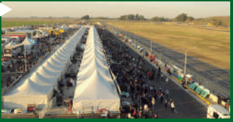
Autódromo local: la hora de los pedidos Pág. 02